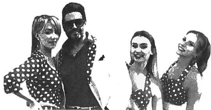
Miki Niki és a Csinibabák

A népszerű énekes házaspár 2024-ben új, lendületes és rendkívül színvonalas műsorral jelentkeznek. A POP műfajban garانتáltan a legjobb áron ajánljuk.