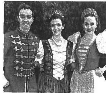
Magyar Operett Társulat