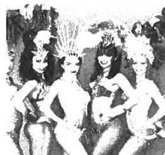
Reinas del ritmo show