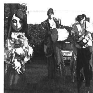
Vagabanda - Gólyalábaso!