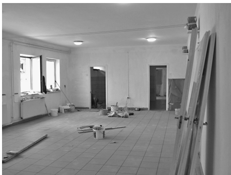
Aljzatburkolás a Béke úti óvoda épületben

A Béke úti óvoda épület gyermek- és felnőtt vizesblokkjai, valamint a zsibongója és a folyosója került felújításra, közel 2 800 000-Ft. értékben. Az Árpád úti épület tálaló konyhájának felújítására pályázatot adtunk be, melynek költségvetése 4 500 000-Ft. Jó reménnyel várjuk a pályázat eredményhirdetését.