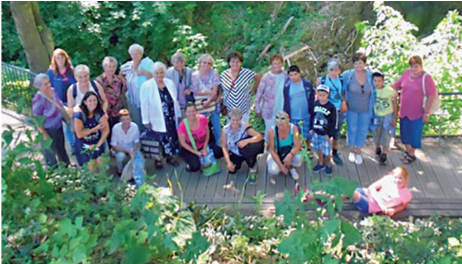
Lillafüredre kirándultak a nyugdíjasok