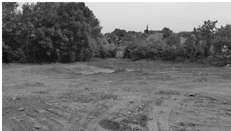
Az épülő szánkópálya

táborhelyet is magába foglaló, szórakoztató és kalandparkká terebélyesedik.