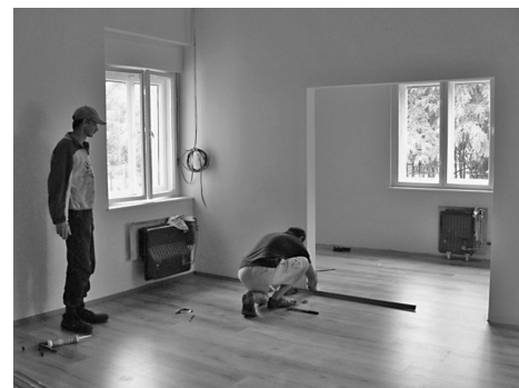
Laminált padló készítése

Fel lett újítva és részlegesen berendezésre került a József Attila úti – a jövőben jegyzői lakásként funkcionáló - 13/a számú szolgálati lakás 500 000-Ft. értékben.