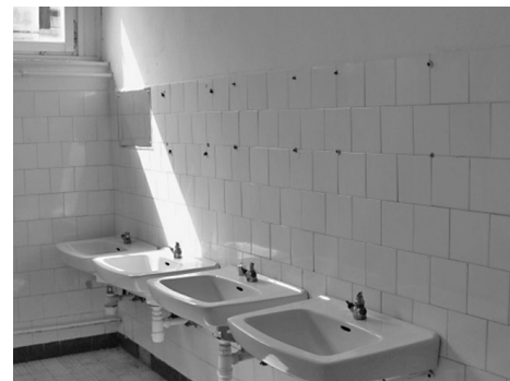
Tönkretett csapok, hiányzó tükrök az iskola öltözőjében

letegyüttes megfelelő állapotszintre hozása saját forrásból ma már nem megoldható, ehhez pályázati forrás megszerzése elengedhetetlen. A pályázati lehetőségeket, a külső anyagi forrás megszerzésének lehetőségét folyamatosan kutatjuk. Az iskola nevelői szobájába saját karbantartóink általi kivitelezéssel konyhaszekrény elemek, valamint tanári munkahelyek bútorzatai kerültek beépítésre, mintegy 190 000-Ft. értékben.