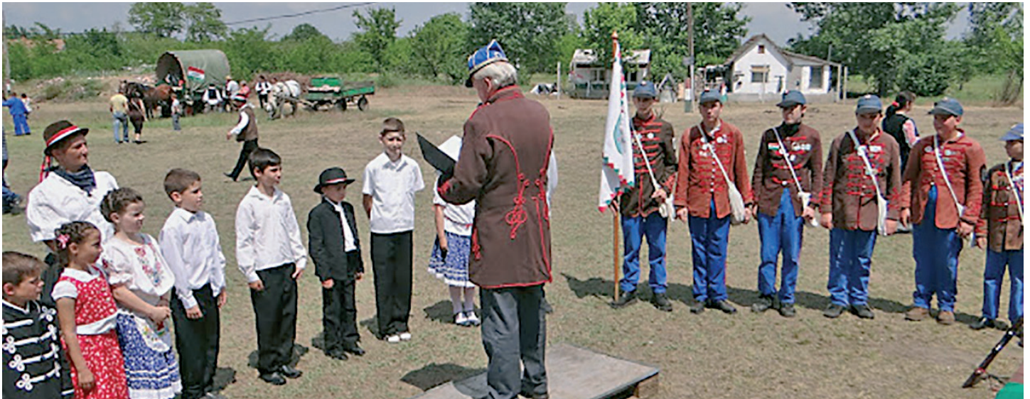
A Famosi Népfelkelő Csapat megalakulása