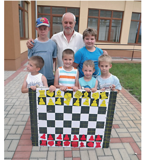
A sakkszakkör résztvevői