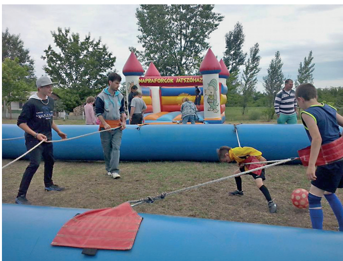
Élő csocsó a famoszi gyermeknapon