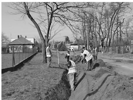
Szikkasztó árok ásása az Ady Endre út mentén

2015 kora tavaszán csatlakoztunk a BM. Start Munkaprogramjához , mely keretén belül 15 fő közfoglalkoztatott egy éven át munkálkodik a település vízelvezető árknak kialakításán, a meglévő árkok karbantartásán, tisztításán, gyommentesítésén, járdák, utak építésén, karbantartásán, a parlagfű szezon beálltával a parlagfű folyamatos irtásán. Sajnos a munka terhét, az elvárt munkafegyelmet több közfoglalkoztatott nem tudta elviselni, és ki önszántából, ki kényszerből távozott a munkaprogramosok köréből. Szerencsére a „csapat” egy része dicséretes módon, napi munkájával, viselkedésével megfelel az elvárásoknak.