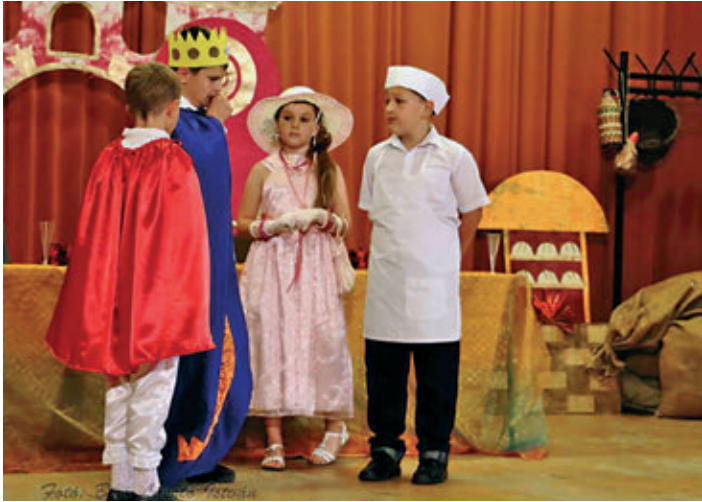
A drámaszakkör előadása