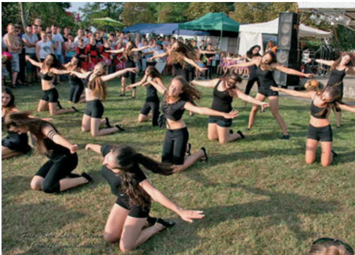
Non Stop Dance Group