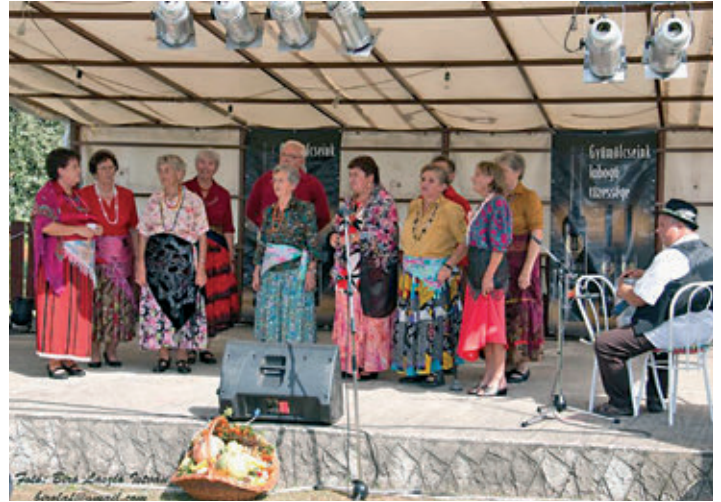
A nyugdíjasok énekelnek