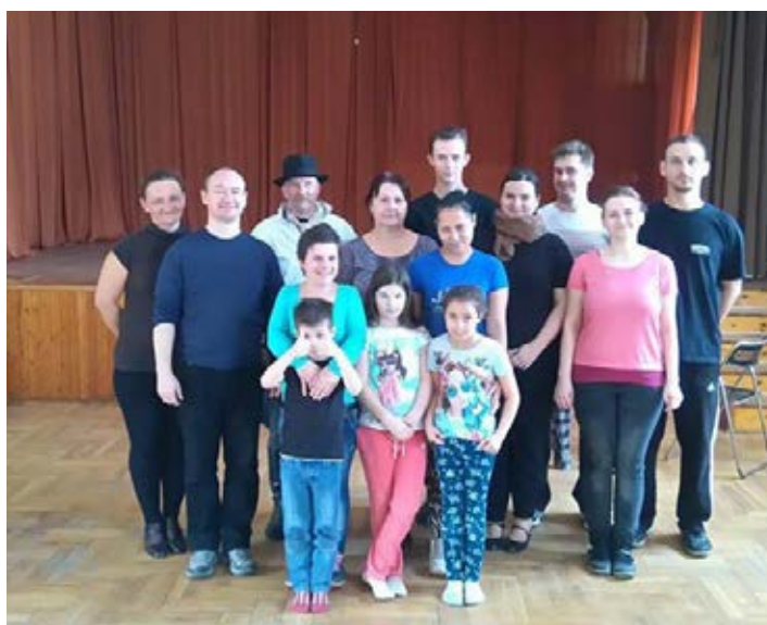
Az első néptánc óra