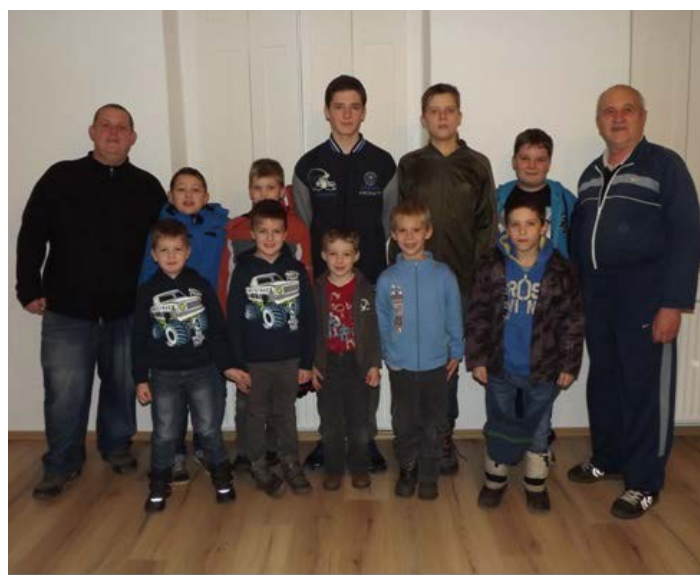
Farmos - Tápiószele Baráti Sakktalálkozó