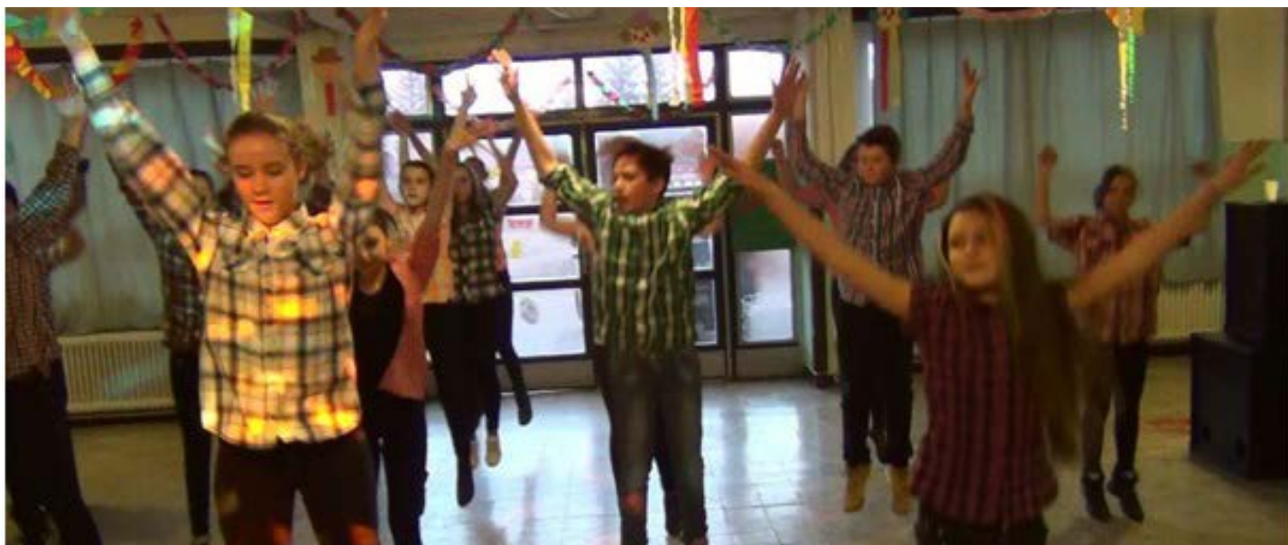
7. osztályosok farsangi műsora