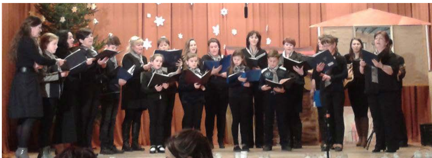
Marana tha énekar a Farmosi Adventen