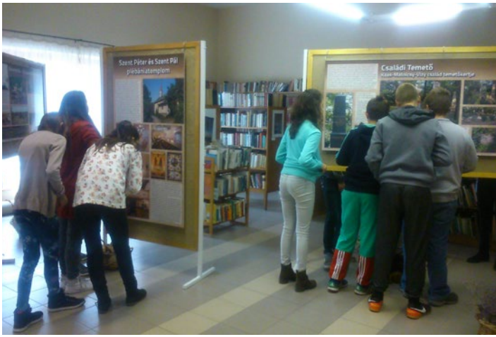
Az általános iskolások az értéktár-kiállításon