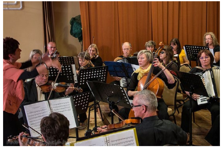
A Farmosi Zenekar koncertje a falunapon