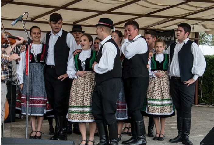
Erdélyi testvértelepülésünk fellépése a falunapon