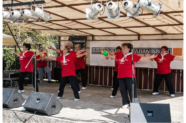
A Rózsa Nyugdíjas Klub fellépése a falunapon