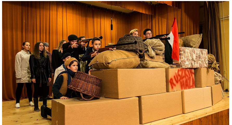
Az általános iskolások október 23-i előadása