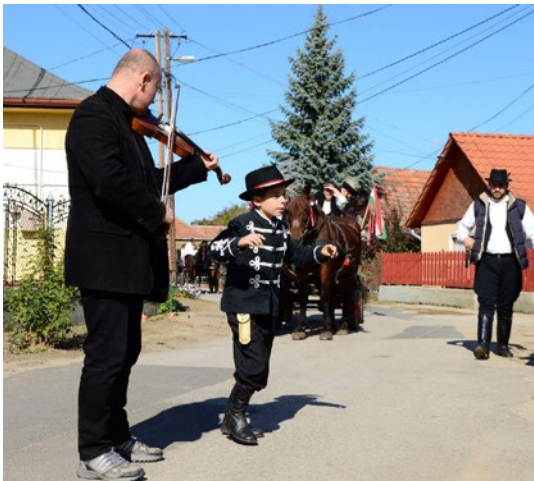
Szüreti Felvonulás pillanatképe