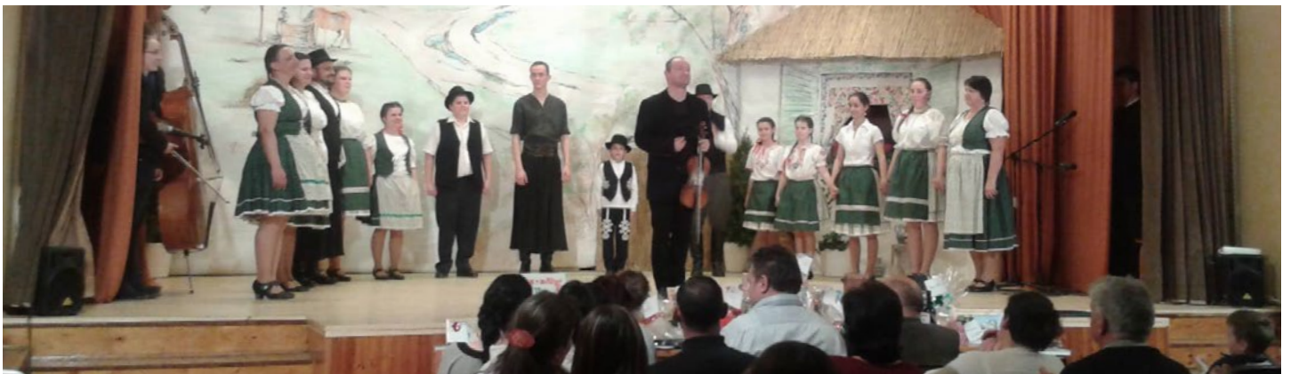
Néptánc Gála Farmoson