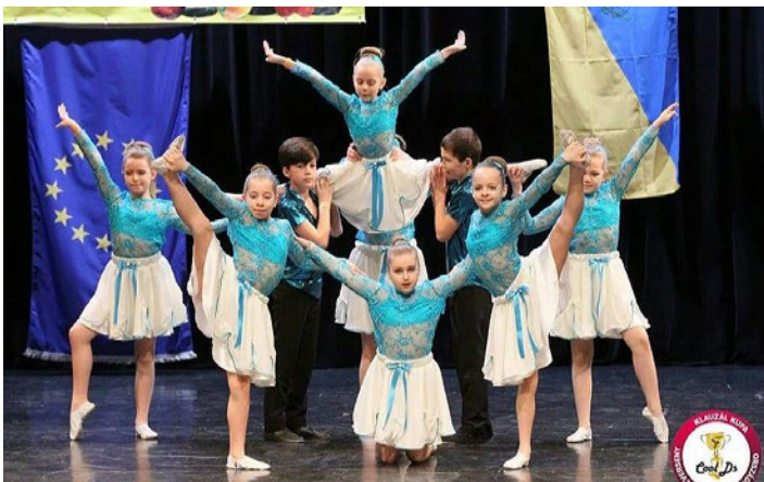
A Non Stop Dance Group Gyermekek csoportja a Klauzál Kupa országos Táncversenyen