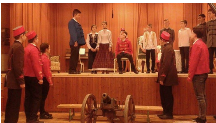
Március 15., az általános iskolás diákok előadása