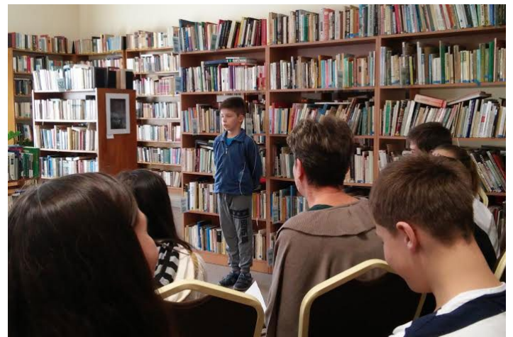
Költészet napja a könyvtárban