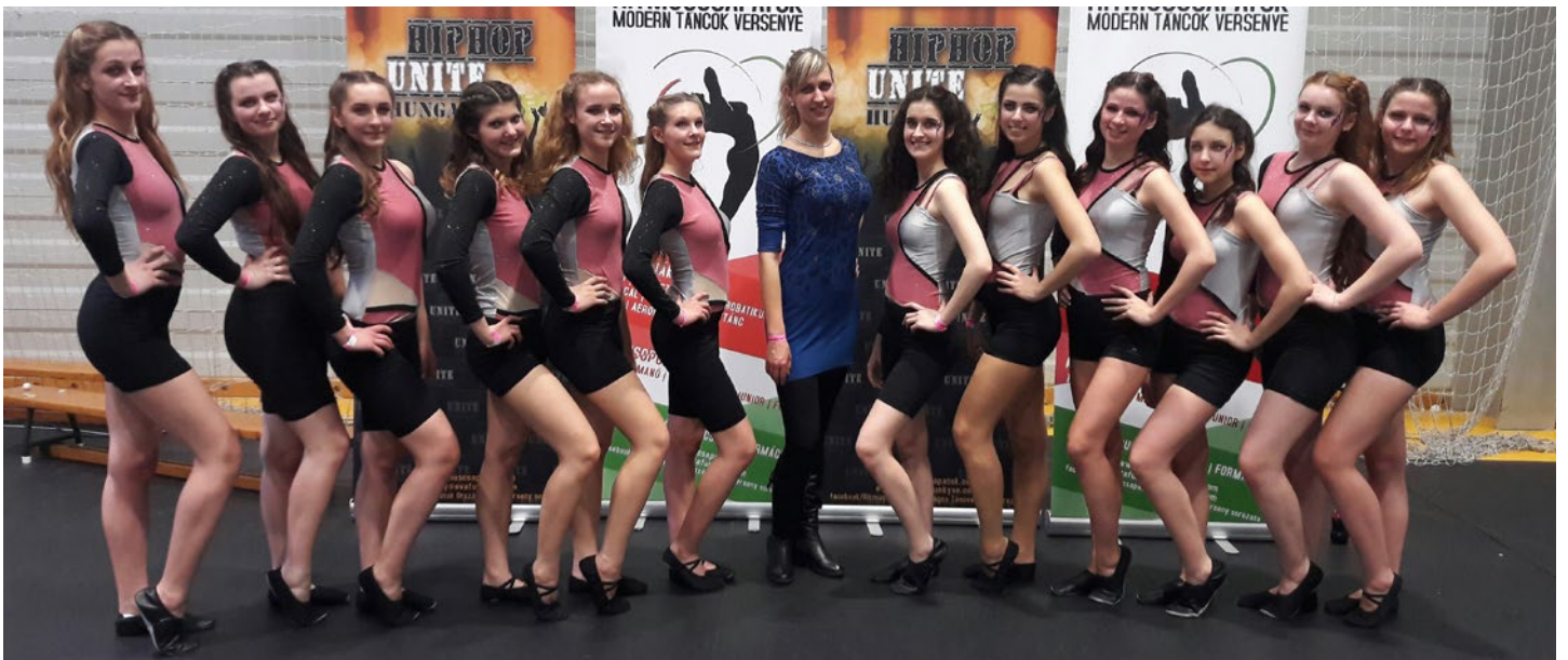
A Non Stop Dance Group Ifjúsági csoportja a Ritmuscsoportok Országos Táncversenyén