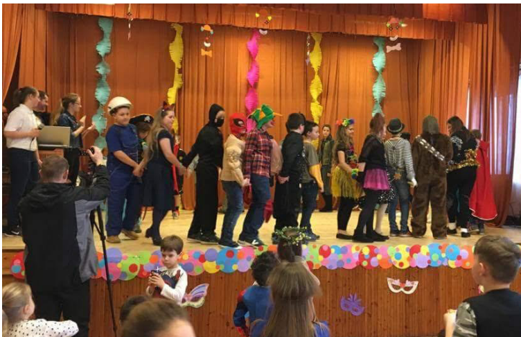
Az alsó tagozatos diákok farsangja