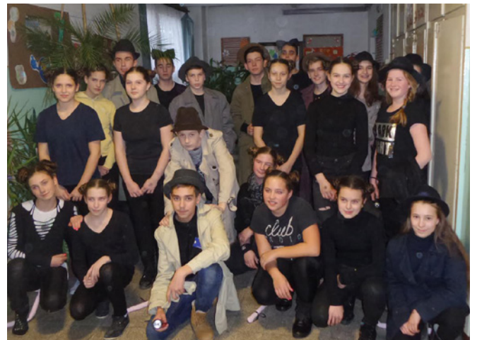
A felső tagozatos diákok farsangja