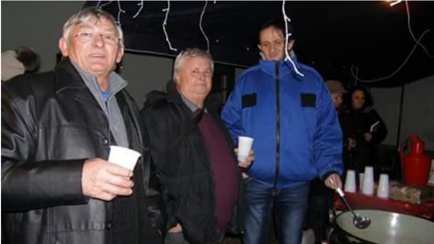
A Farnoszi Advent pillanatképe