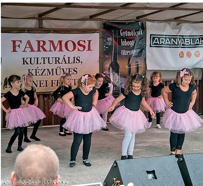
Óvodások fellépése a falunapon