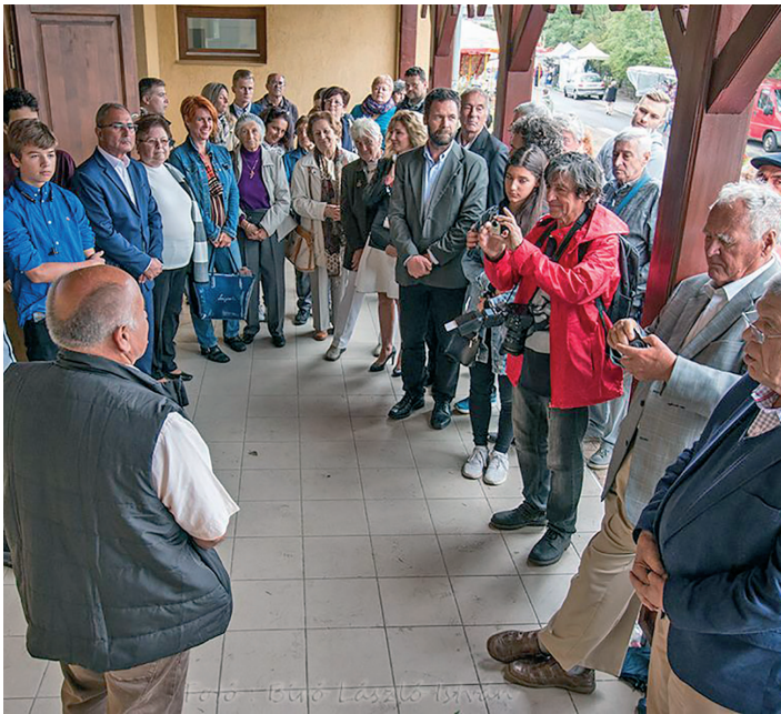
A Matolcsy emléktábla átadása