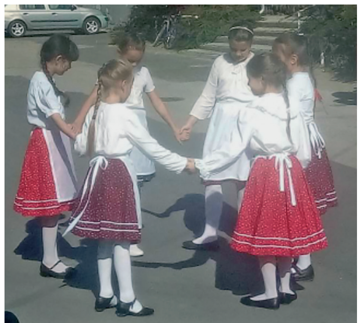
Aprócsuhajják a Szüreti felvonuláson