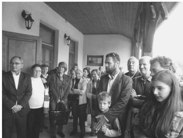
Az ünneplők egy csoportja