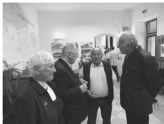
Beszélgetés a Kúriában