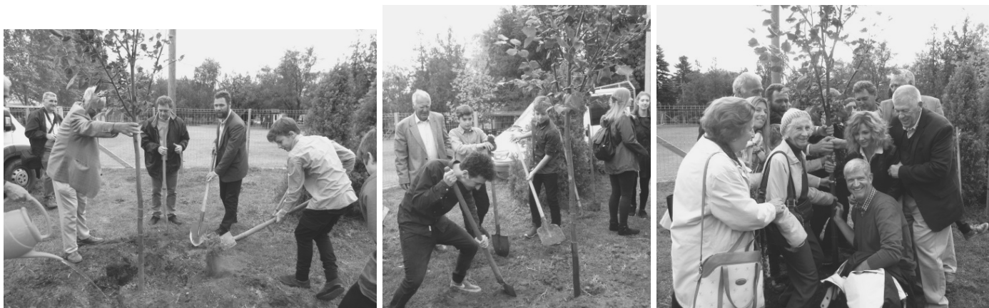
Matolcsy családfa ültetése a Matolcsy Emléparkban

Az ünnepség záróeseménye az állófogadás volt, amelyben Farnos Önkormányzata a Közösségi Házban vendégül látta az ünnepség résztvevőit, akik kötetlen beszélgetés keretében üdvözölhették régen látott ismerőseiket, vagy ismerkedhettek eddig nem látottakkal, és megtekinthették a szép kiállítást, tablókat.