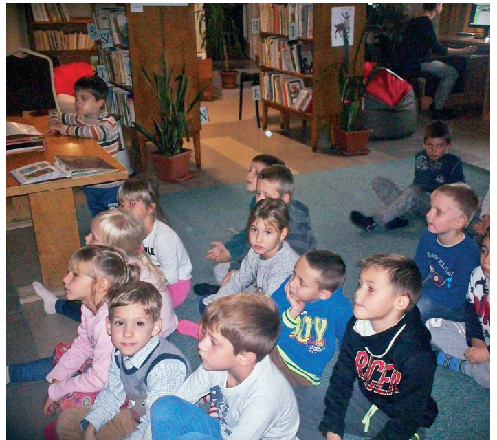
Könyvtárlátogatáson voltak az óvodások