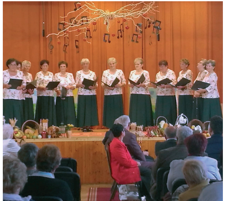
Az 50. házassági évfordulójukat ünneplők köszöntése