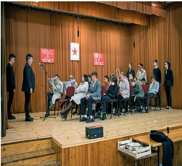
Az általános iskolás diákok előadása az október 23-i megemlékezésen