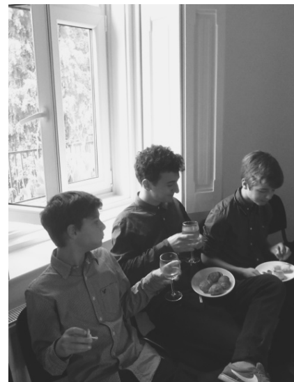
Pillanatképek az állófogadásról

Köszönet mindazoknak, akik a XV. Farnosói Kulturális Napokon bármilyen formában támogatták a farnosói óvodát és az Ovisüti sátrat.