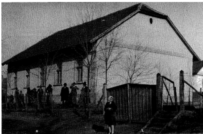
A volt kultúrház, 1948-tól imaház.

négy karót s viszonzá, a szabad tér iránti úri jogára támaszkodva: „Itt iskola lesz! Itt gyermekeitek fognak ezentúl delelni! Mert ideje nekünk is immár az álomból felserkennünk!” És a szent szózat hallatára nem akadt többé ember, ki merészelt volna a régi birka legelőt emlegetni. Az épület tervét a báró maga rajzolta, a pallérságot szintén magára vállalta, pénzt is maga ment kérni Németországba, a Lipcse városában székelő Gusztáv-Adolf-egylethez s a mi hiányzott: a magáéból pótolta. S most díszleg az emelkedett téren a tornyos épület, mely iskolát, tanítói lakot és imaházat foglal magában. Az erélyes egyházi atya nélkül, megmaradt volna birka delelőnek az a hely, hol most ifja örege zengi Istennek dicséretét.”