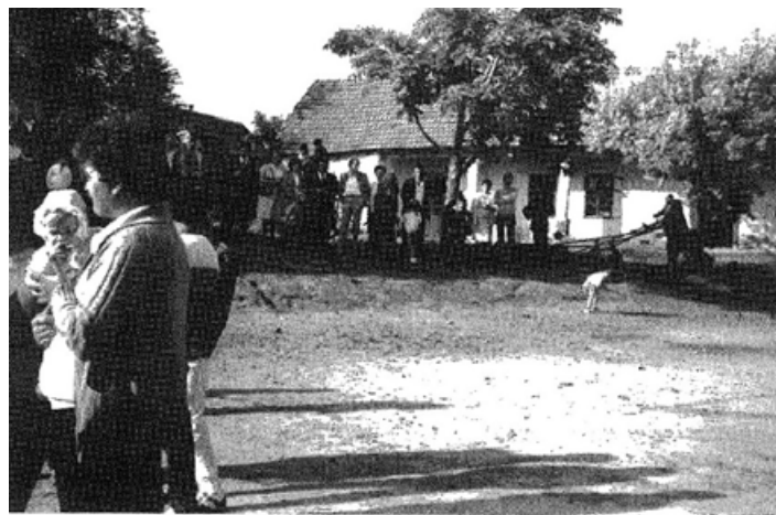
A volt kántortanítói lakás.