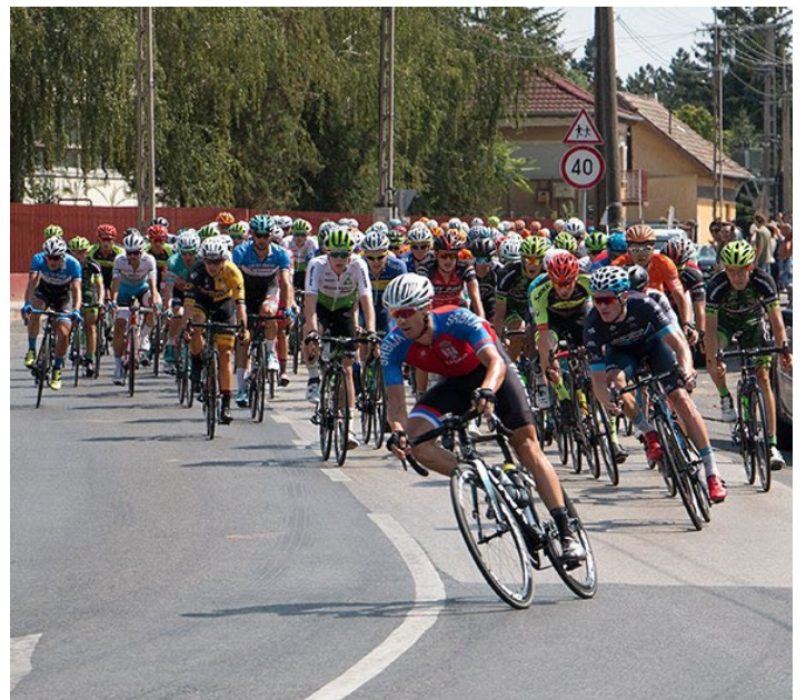
A Tour de Hongrie épp Farmoson halad át