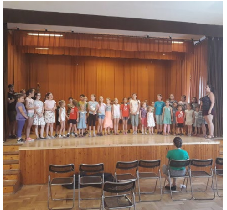
Közös népdaléneklés a III. Csuhajja Néptánc táborban