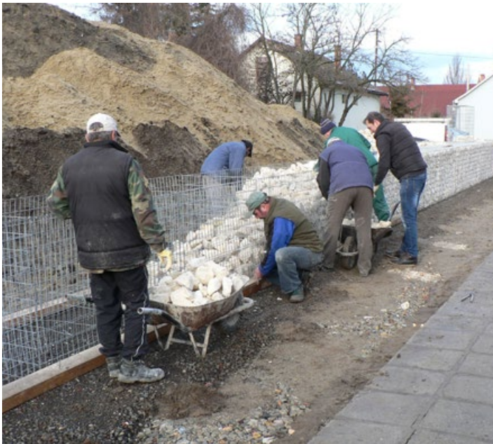
Az új műfüves focipálya készítése közben