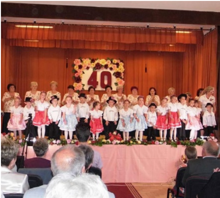
Az óvodások és a nyugdíjasok közös előadása a Nyugdíjas Egyesület évfordulóján