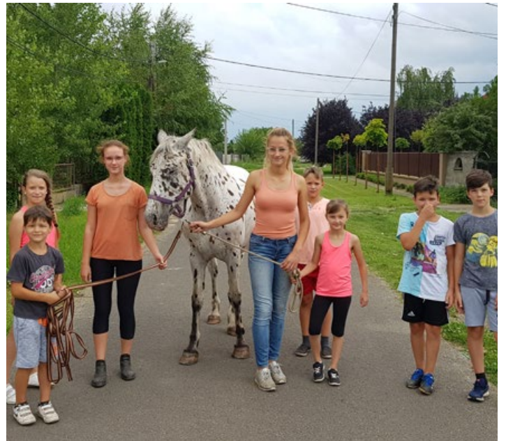
Az Atlantisz Szabadidő Egyesület lovas tábora