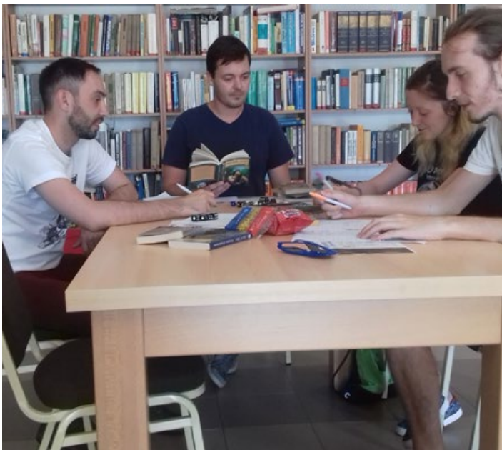
Első szerepjátékos délután a farmosi könyvtárban