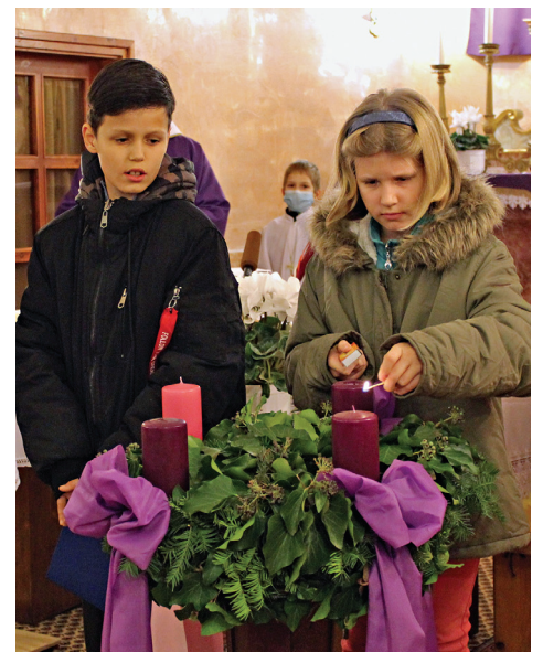
Advent 1. vasárnapját megelőző szombati gyertyagyújtás a katolikus templomban