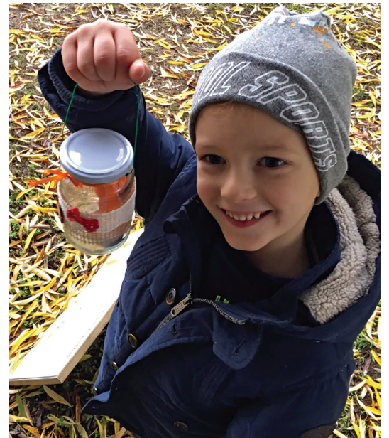
Márton-napi libakergetés egyik győztese