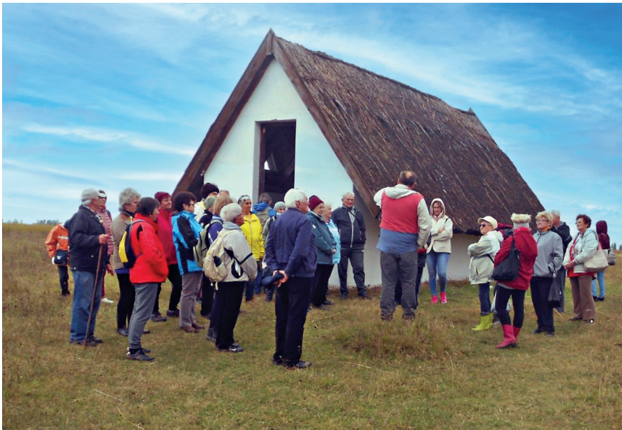
Nyugdíjasaink túráznak az Idősek Világnapján