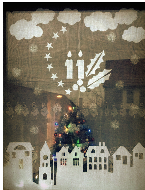
Az adventi falunaptár egyik ablaka