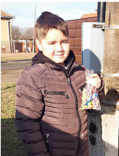
Mikulás-napi kincskeresés egyik győztese