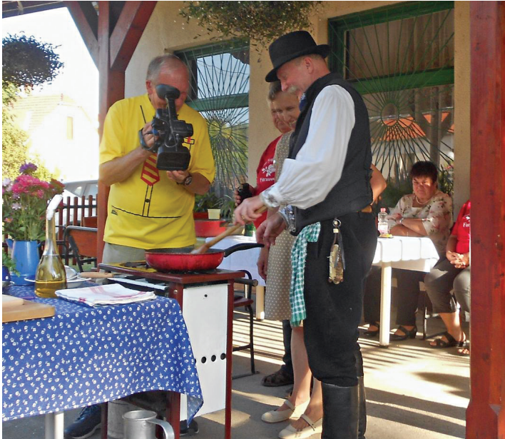
Ízörzök forgatása Farmoson