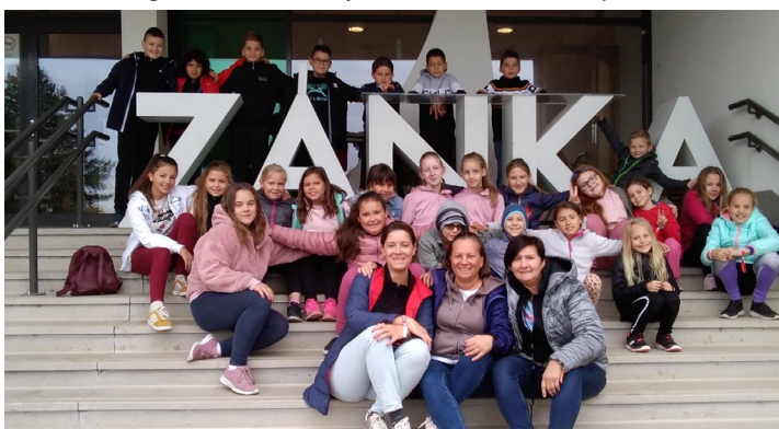
Farmosi gyerekek a zánkai táborban