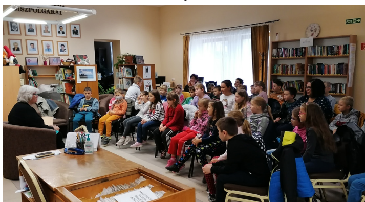
Mustármag Mikroműhely a farmosi könyvtárban