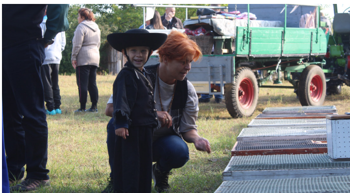
Szüreti felvonulás a Ligetnél