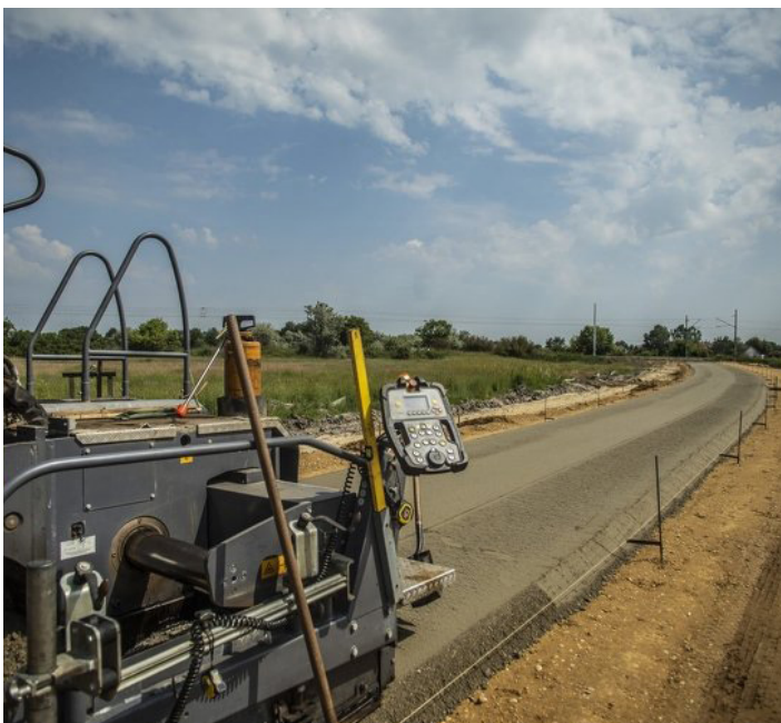
Zajlanak a munkálatok Farmoson

A fejlesztés az ITM megbízásából a NIF Nemzeti Infrastruktúra Fejlesztő Zrt. beruházásában uniós és hazai forrás bevonásával valósul meg.