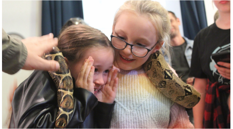
Kutatók éjszakája a Vízparti Élet Házában