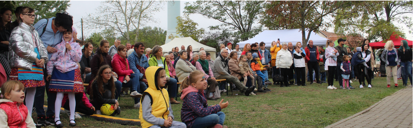
Közönség a falunapon