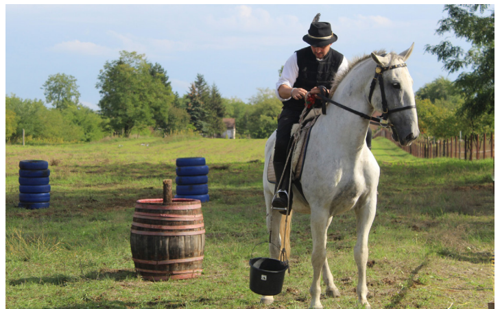
Szüreti felvonulás, 2022