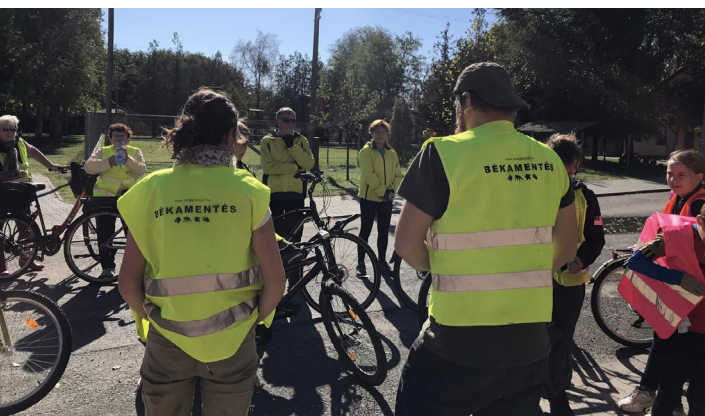
Tekerj a Zöldbe a békákért! kerékpártúra Farnos-Tápiószentmárton körül