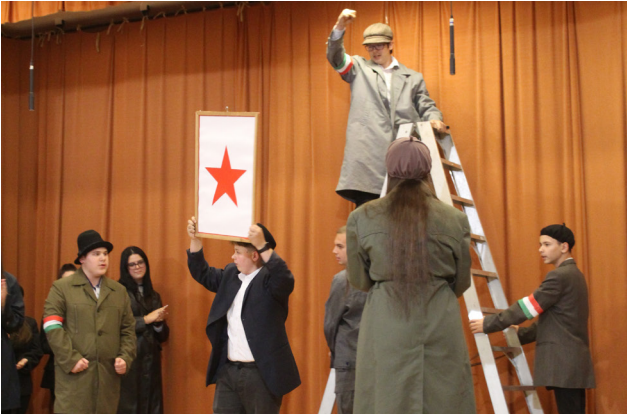
A nyolcadik osztályos tanulók előadása az október 23-i megemlékezésen