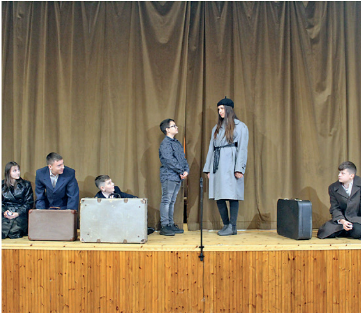
A 8. osztály előadása az október 23-i megemlékezésen