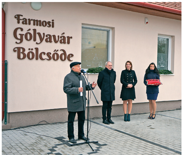
A bölcsőde átadóünnepsége