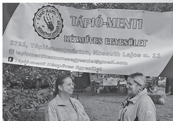
Tápió-menti Kézműves Egyesület vezetősége