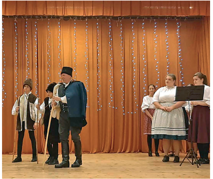
A Hagyományörző Egyesület betlehemes játéka