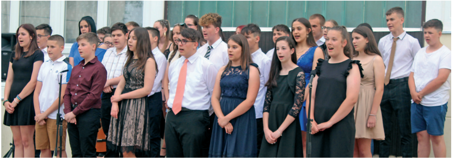
A 8. osztály szerenádjá