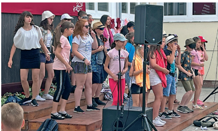
Tanévzáró ünnepség, 2023