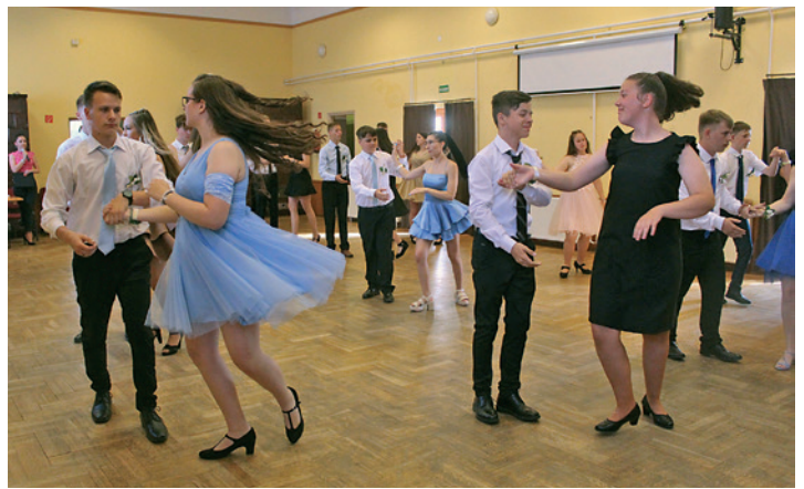
A 8. osztály táncvizsgálja