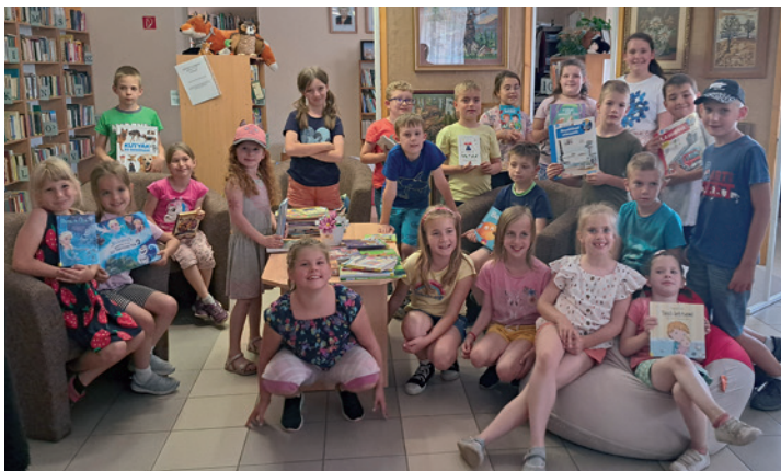
Erzsébet táborsok a könyvtárban