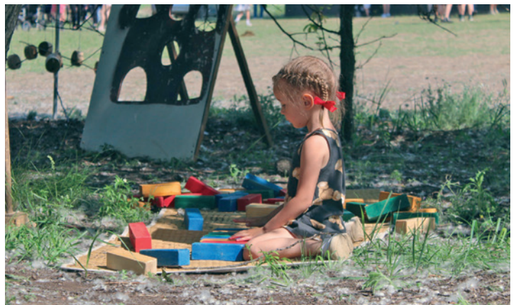
Gyereknapi a Ligetben