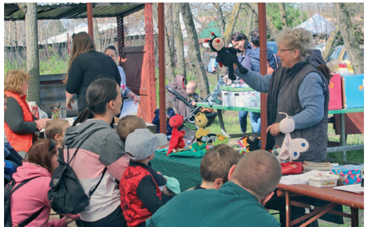
Kézműves vásár és Föld napja a Ligetnél