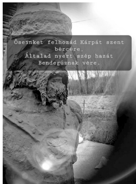
A képen Bendegúz hun nagykirály

nemezelés, rákász, pákász, csikász, kovács és egyéb mesterségek bemutatását vállalva adhatjuk át kicsiknek és nagyoknak ezeket a sajnos feledésbe merült régi foglalkozásokat. Szeretnénk több, egymás utáni tanfolyamokkal élvezetessé tenni községünk tagjainak életét. Augusztus-szeptember között tervezek egy mára már nagyüzemivé vált, házikertekben elfeledett mesterséget bemutatni és átadni látogatóinknak.