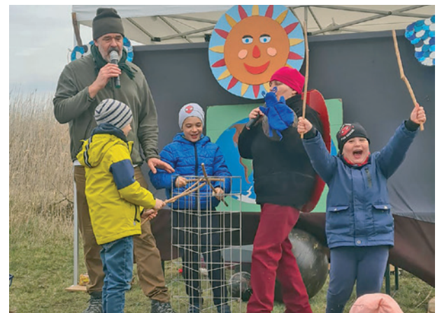
Gólyaváró családi nap a Farmosi Madárvártán