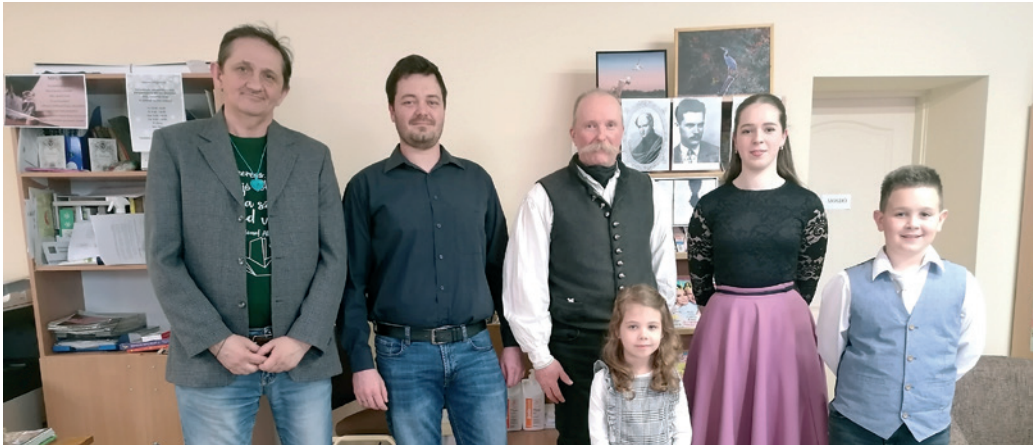
Magyar Költészet Napja a farmosi könyvtárban