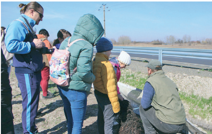
Békamentéssel egybekötött tájséta Farmoson