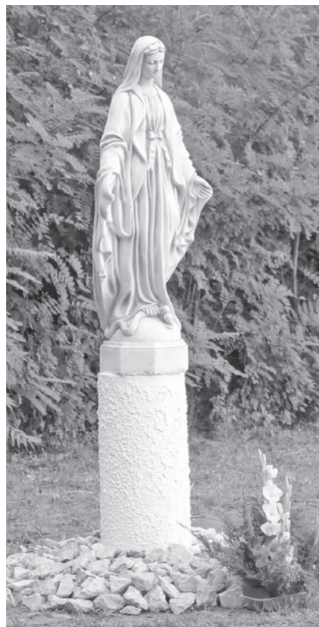
A képen a Farnoszi Szűz Mária szobor