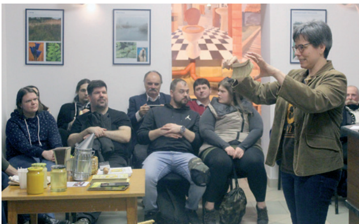
Márciusi zöld napok estje a Vízparti Élet Házában