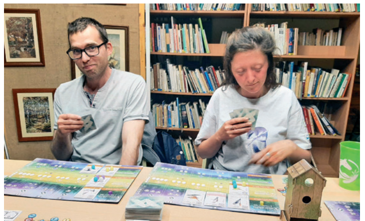
Társasjáték klub a farmosi könyvtárban